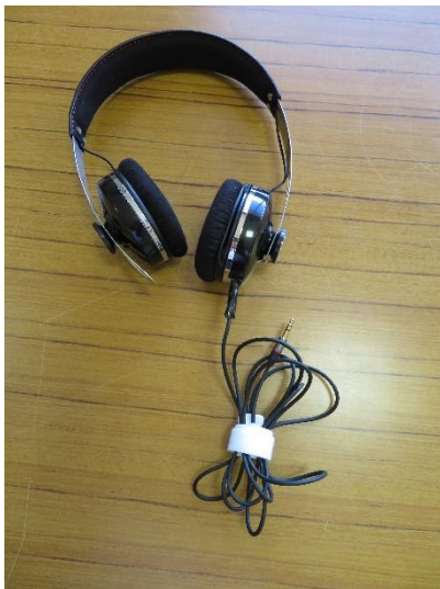
モニター用ヘッドフォン CLASSIC PRO CPH3000 BLACK