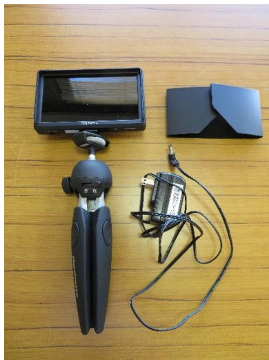
モニター FEELWORLD FW568