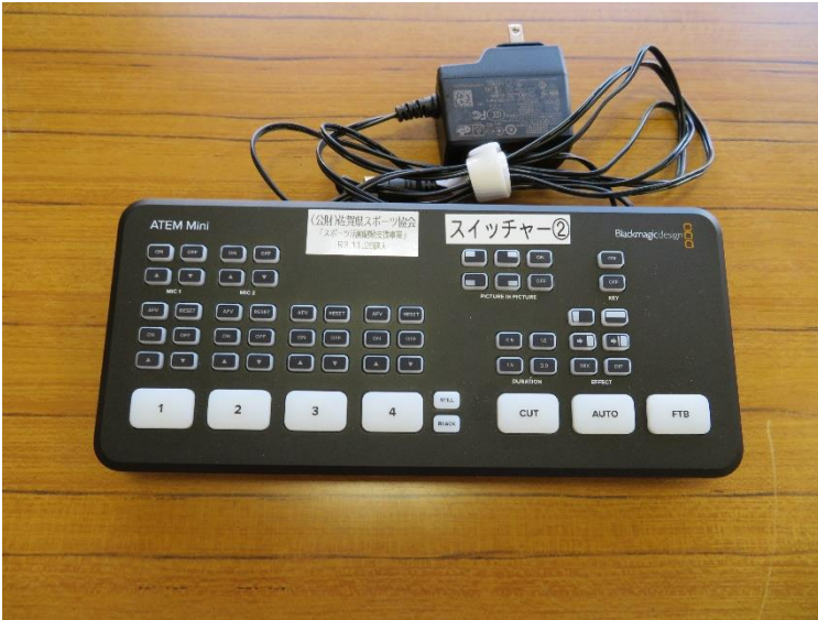
Blackmagic design ATEM Mini