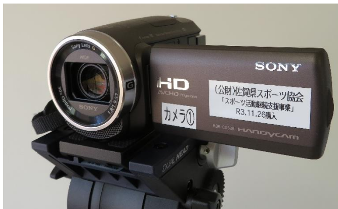
SONY フルハイビジョンビデオカメラ (HDR-CX680)