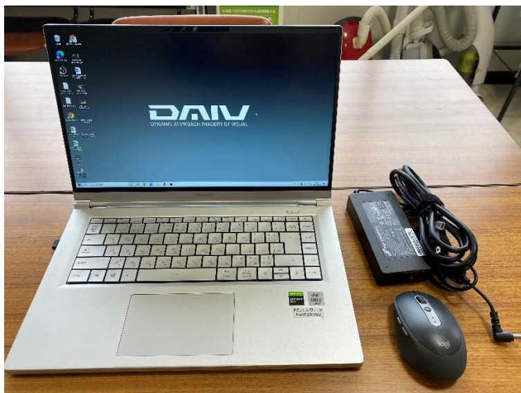
マウスコンピューター (DAIV 5P)